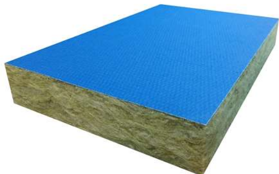
ПАЛИТРА СО 40мм